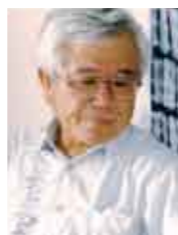
上原 剛 琉球大学教授