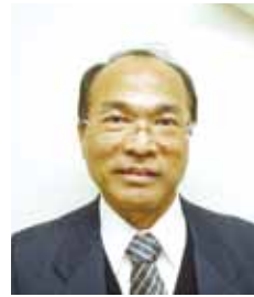
高良 富夫 たから とみお 琉球大学工学部長、教授