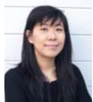
よしもとばなな (作家)