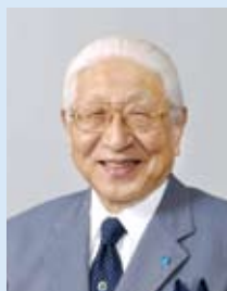
株式会社 堀場製作所 最高顧問 堀場 雅夫

大正 13 年、京都市生まれ。昭和 20 年、京都大学理学部在学中に堀場無線研究所を創業。学生ベンチャーの草分けと呼ばれる。国産初のガラス電極式 pH メーターの開発に成功し、昭和 28 年、堀場製作所を設立する。社員に博士号の取得を推奨し、自身も昭和 36 年に医学博士号を取得。