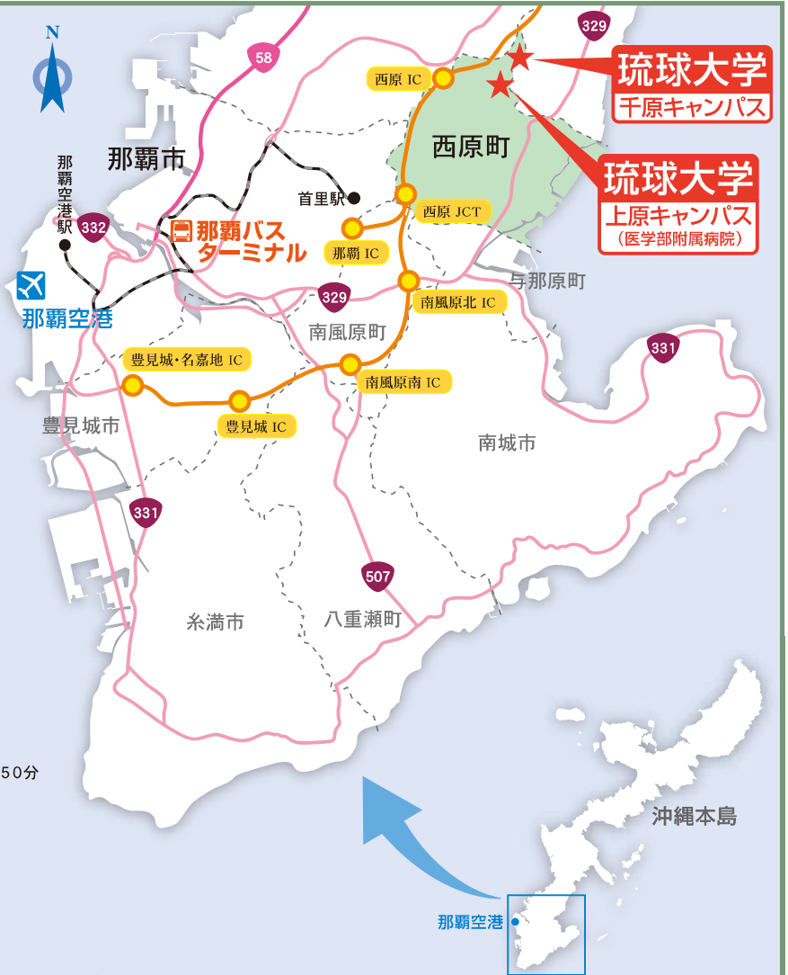
琉球大学 千原キャンパス

■経路：バスターミナル⇒国際通り(牧志)⇒バイパス⇒ 真栄原⇒沖国大前⇒琉大北口(終点)