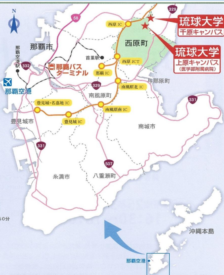
琉球大学 千原キャンパス