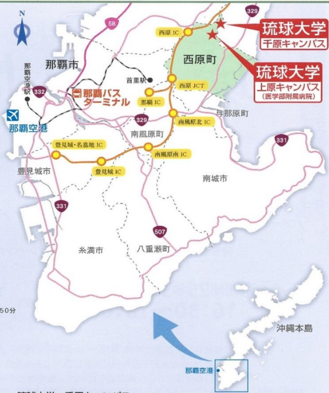
琉球大学 千原キャンパス