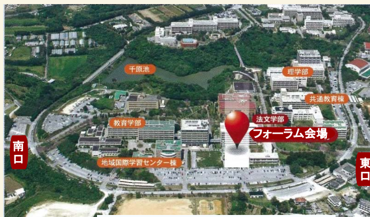
琉球大学 千原キャンパス