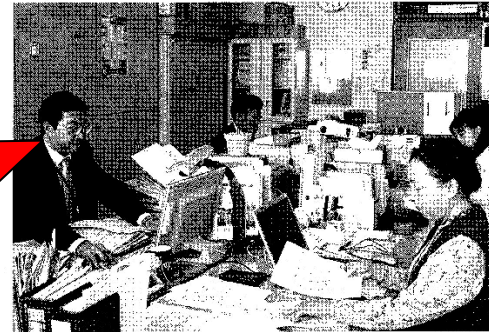
岩手大で利益相反を担当する部門。産学連携が活発になるにつれて、利益相反に関する相談も増えているという

「金もつけないためじゃない。技術発展や日本経済への貢献のためにやっている。なぜ懐具合まで探られなければならないのか（怒）！！」