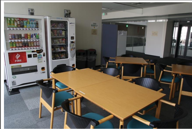
⑦ ラウンジ (5階、40㎡)