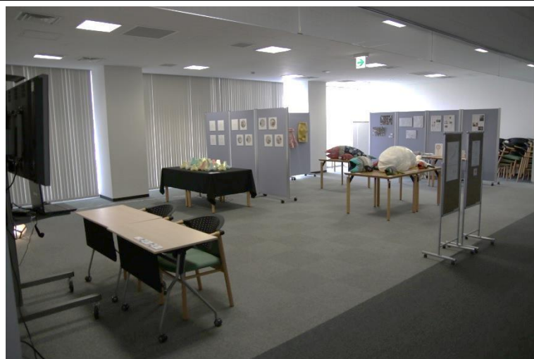
② 情報交換スペース (3階、94㎡)