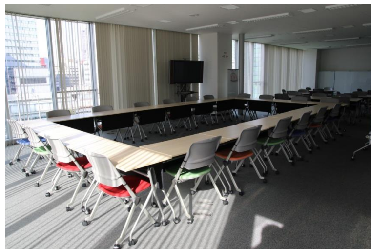
⑤ リエゾンコーナー509 (5階、138㎡)