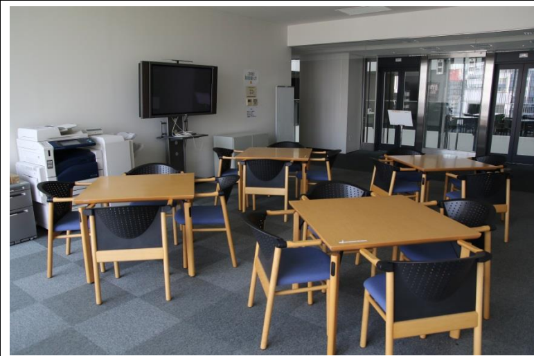
⑧ ラウンジ (6階、40㎡)