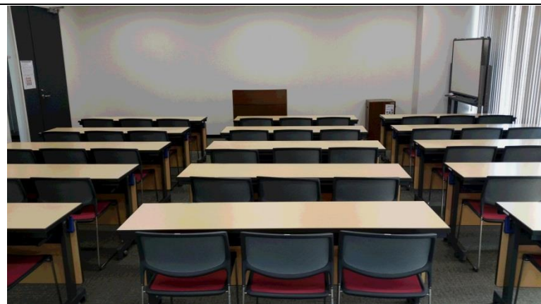
⑪ 多目的室1 (2階、70㎡、45人収容)