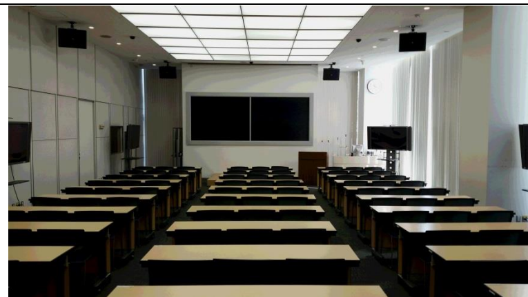
⑩ 国際会議室 (1階、169㎡、99人収容)