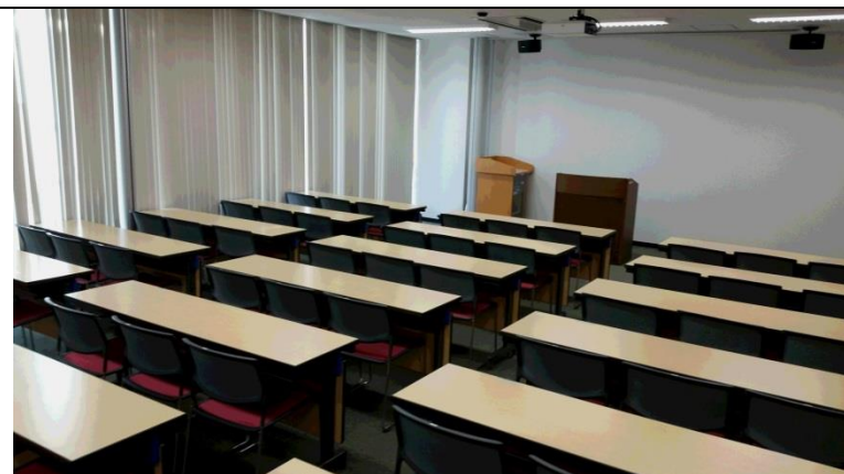
⑫ 多目的室2 (2階、88㎡、51人収容)